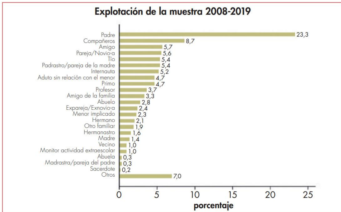
Gráfico 136.- ¿Quién es el agresor?