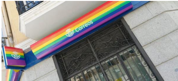
Sede de una oficina de Correos decorada con motivos LGTB.