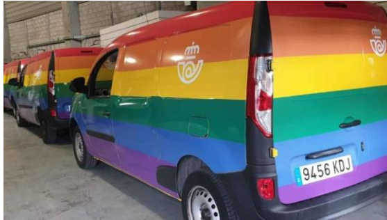
Furgonetas de Correos viniladas con la bandera LGTB