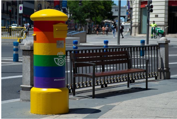
Buzón de Correos con la bandera LGTBI en Gran Vía, Madrid. 2020