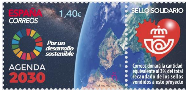
Sello solidario. Agenda 2030. Por un desarrollo sostenible. 25 septiembre 2019