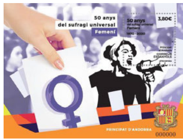
Efemèrides. 50 anys del sufragi universal femeni. 29 mayo 2020