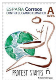
Contra el cambio climático. Protest Stamps. 26 marzo 2020